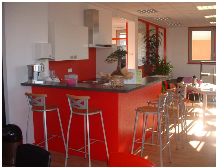
La cuisine de la Maison de l'Adolescent

Le BAPU a été créé en 1998, il fonctionne dans les mêmes lieux et le même cadre administratif que le Centre médico psychopédagogique de l'Académie (Rue Chifflet à Besançon). Cette rencontre avait pour but de coordonner cette activité du BAPU avec les différents services concernés par les adolescents et étudiants en difficulté. Elle a permis de réfléchir à une meilleure articulation au niveau des informations et des orientations les concernant, à partir de la Maison de l'Adolescent.